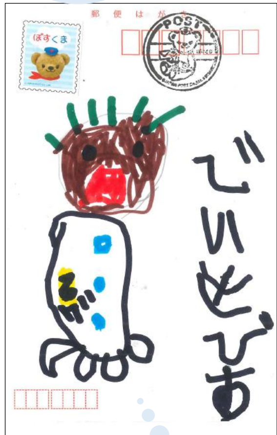
「芝人形」 でいさーびす こうせいくん